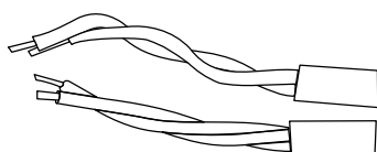
cabos de ligação